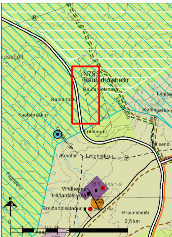
Gildandi Aðalskipulag Ölfuss 2010-2022 í mkv. 1:50.000.