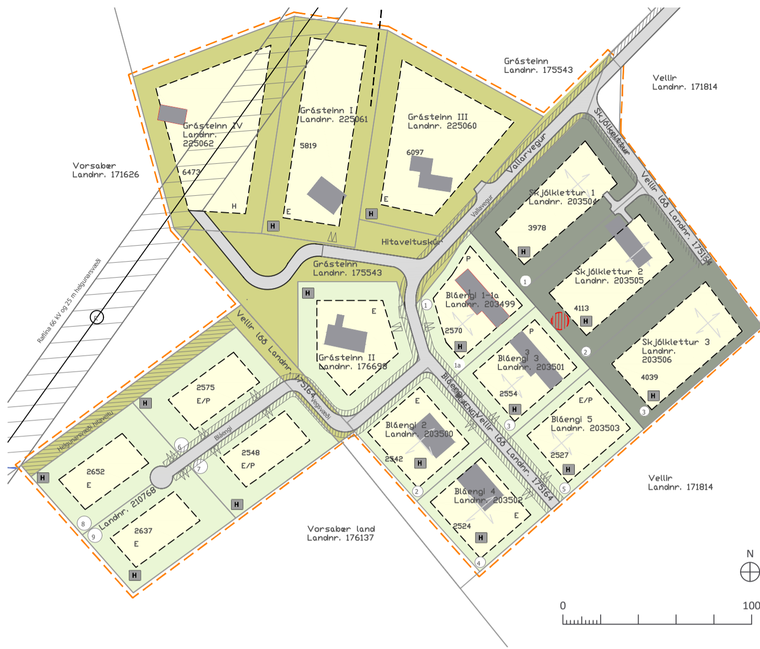
GILDANDI DEILISKIPULAGSUPPDRÁTTUR 1:2000