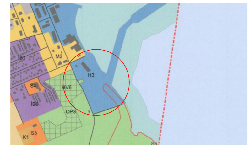
AÐALSKIPULAG SVEITARFÉLAGSINS ÖLFUS 2020-2036 - PÉTTBYLISUPPRÁTTUR