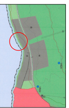
Húli of Aðalkauplúgi Útluss 2020-2035

Deiliskauplúgð hefur fengið meðferð í samræmi við ókvæði 41 gr. skipulagsásto þr 123/2010 vor samþykkt í _____ þann _____ 20__ óg _____ þann _____ 20__ óg Tilgatan var auglýst frá _____ 20__ með úthugasemidöðrestu til _____ 20__ Auglýsing um gildisbók deiliskauplúgsins var birt í B-eldið Stjórnartíðinda þann _____ 20__