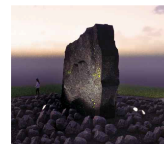
Steinninn "Latur" settur upp á rönd