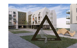
Hugmynd að myndatökuramma

Miðbær Porlákshöfn Miðbæjartorg - yfirlitsmynd Dags. 26.9.2024