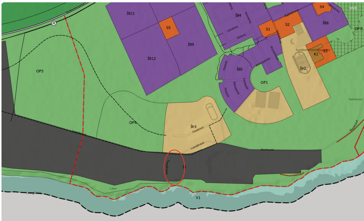
MYND 1. Aðalskipulag Sveitarfélagsins Ölfuss 2020-2036. Skipulagssvæðið er innan rauða hringins.