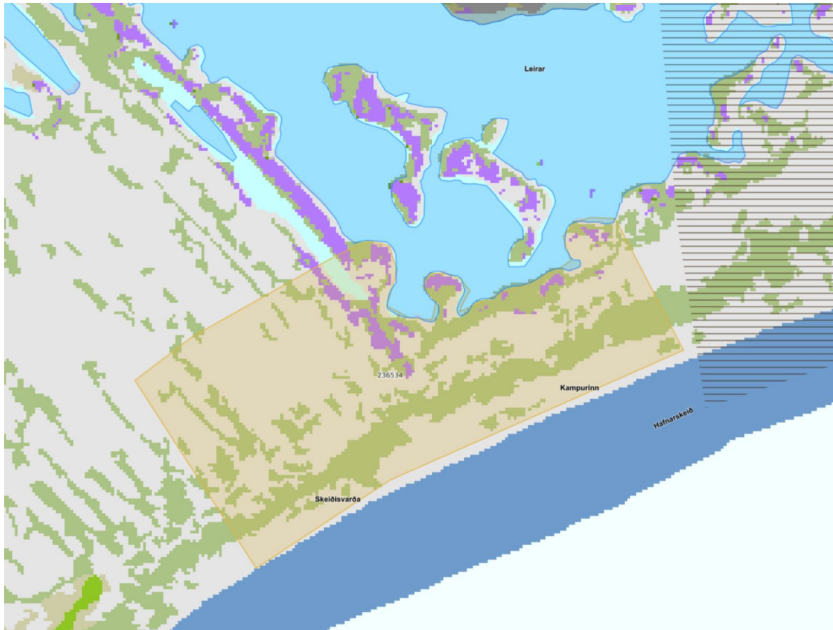
Mynd 1 af vefsíðu alta, gögn af vef Náttúrufræðistofnunar

Skipulagið gerir ráð fyrir að fjarlægð bygginga frá tjörnum á Hafnarskeiði verði nægjanleg, sbr. ákvæði 5.3.2.14 í skipulagsreglugerð nr. 90/2013 og til að tryggja að framkvæmdir valdi ekki raski á tjörnum norðaustan við skipulagssvæðið sem njóta sérstakrar verndar skv. 61.gr laga nr. 60/2013 um náttúruvernd. Í nánari útfærslu skipulags og þróun svæðis verður sérstaklega hugað að því að styðja við þau einstöku gæði sem felast í nálægðinni við tjarnir og fuglalíf Ölfus m.a. með merkingum um fuglalíf staðarins, farleiða þeirra og lífríkis nálægra tjarna. Leitast verður við að staðsetja og hanna mannvirki með þeim hætti að hægt verði að njóta nálægðar við hið náttúrulega umhverfi um leið og leitast er við að lágmarka truflun og rask, t.d. með fuglaskoðunar hýsum.