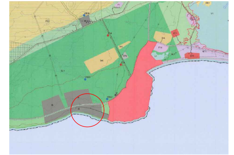
HLUTI ADALSKIPULAGS ÖLFUSS 2020-2036